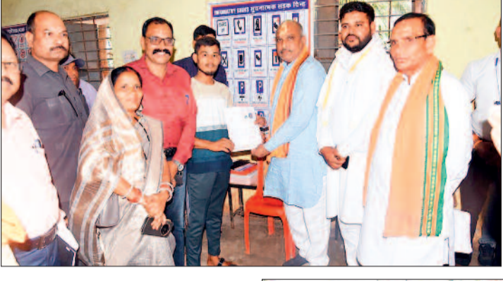
हरिभूमि न्यूज ▶▶ अण्डा

राज्य शासन के निर्देशानुसार शासकीय कार्यों में पारदर्शिता तथा योजनाओं और कार्यक्रमों के प्रभावी क्रियान्वयन को सुनिश्चित करने हेतु संचालित सुशासन तिहार-2026 के अंतर्गत जिले के ग्रामीण अंचलों में जनसमस्या निवारण शिविरों का आयोजन किया जा रहा है। इसी कड़ी में जनपद पंचायत दुर्ग अंतर्गत ग्राम पंचायत कुथरेल में जिला स्तरीय सुशासन तिहार का सफल आयोजन किया गया, जहां बड़ी संख्या में ग्रामीणों ने पहुंचकर अपनी समस्याएं और मांगें प्रशासन के समक्ष रखीं। शिविर में महिला एवं बाल विकास विभाग द्वारा विभाग की विभिन्न जनकल्याणकारी योजनाओं की विस्तृत जानकारी ग्रामीणों को दी गई। विभाग द्वारा महतारी वंदन योजना, प्रधानमंत्री मातृ वंदन योजना, नोनी सुरक्षा योजना, सुकन्या समृद्धि योजना, मुख्यमंत्री सामूहिक कन्या विवाह योजना, छत्तीसगढ़ महिला कोष एवं सक्षम योजना के बारे में जानकारी प्रदान की गई। इसके अलावा विभाग द्वारा महिला