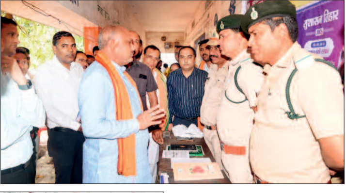
हरिभूमि न्यूज ▶▶ अण्डा

राज्य शासन के निर्देशानुसार शासकीय कार्यों में पारदर्शिता तथा योजनाओं और कार्यक्रमों के प्रभावी क्रियान्वयन को सुनिश्चित करने हेतु संचालित सुशासन तिहार-2026 के अंतर्गत जिले के ग्रामीण अंचलों में जनसमस्या निवारण शिविरों का आयोजन किया जा रहा है। इसी कड़ी में जनपद पंचायत दुर्ग अंतर्गत ग्राम पंचायत कुथरेल में जिला स्तरीय सुशासन तिहार का सफल आयोजन किया गया, जहां बड़ी संख्या में ग्रामीणों ने पहुंचकर अपनी समस्याएं और मांगें प्रशासन के समक्ष रखीं। शिविर में महिला एवं बाल विकास विभाग द्वारा विभाग की विभिन्न जनकल्याणकारी योजनाओं की विस्तृत जानकारी ग्रामीणों को दी गई। विभाग द्वारा महतारी वंदन योजना, प्रधानमंत्री मातृ वंदन योजना, नोनी सुरक्षा योजना, सुकन्या समृद्धि योजना, मुख्यमंत्री सामूहिक कन्या विवाह योजना, छत्तीसगढ़ महिला कोष एवं सक्षम योजना के बारे में जानकारी प्रदान की गई। इसके अलावा विभाग द्वारा महिला